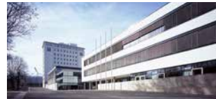
Abgeordnetenhochhaus, Plenarsaal, Funktionsgebäude