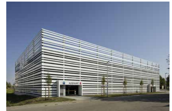
Blick von der IHK

Das Parkhaus befindet sich gegenüber der IHK Heilbronn-Franken und wurde in Split-Level-Bauweise mit 272 Stellplätzen konzipiert. Als Bauweise wurde eine effiziente Stahlverbundbauweise gewählt, die die einzelnen Ebenen stützenfrei überspannt. Die neun Halbebenen werden über zwei Rampenanlagen erschlossen. Mit seiner anspruchsvollen Fassade aus horizontalen, unterschiedlich breiten Lamellen präsentiert sich das Parkhaus nicht nur als Funktionsbau, sondern fügt sich auch harmonisch in die umgebende Bebauung ein.