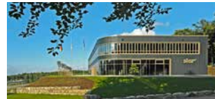
In der Landschaft