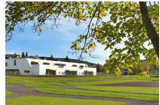
Lage im Gelände

Die Nähe zur Sporthalle erzeugt gemeinsam mit dem Schulgebäude eine lockere den weiten Landschaftsraum rahmende Gebäudegruppe. Durch das Abrücken vom Rötweg entsteht ein großzügiger besonnener, geschützter Vorbereich für Kiss + Go, Spiele + Feste mit direkter Anbindung von Mehrzweckraum / Essen + Küche. Hier können die Kinder ihren Bewegungsdrang abgeschirmt vom Straßenraum ausleben. Für die Erweiterung ergeben sich optimale und ungestörte Möglichkeiten vor allem entsprechend der Gebäudeausrichtung nach Süden.